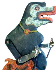
Abbildung Titel (Detail): Die Felsengrotte des Bodhisattva, chinesische Schattenfigur Abbildungen innen von links nach rechts: Junge Frau, Schattenfigur, China Togog, Wayang-klitik-Figur, Indonesien \ Musiker, Wassermarionette, Vietnam Vogel, Schattenfigur, Indien

Figurentheater in Asien heißt Vielfalt und Tradition. Bis heute ist es lebendiger Bestandteil des kulturellen Lebens. Unterschiedlich sind die Geschichten, die erzählt werden. Einige Stücke nehmen sich das Leben an den Königshöfen zum Vorbild oder handeln von Göttern und Dämonen. Andere zeugen von lebendigem Dorfleben. Alte epische Stoffe und moderne Geschichten mischen sich. Die bunte Welt des asiatischen Figurentheaters bildet einen großen Teil der Sammlung Fey jun. Zum 35. Jubiläum des TheaterFigurenMuseums zeigen wir einige unserer Highlights vom größten Kontinent der Erde. Wir begeben uns auf eine Reise, nicht nur durch die Asiatische Sammlung, die auch Bestandteil der Dauerausstellung ist, sondern auch auf eine Reise in das Land der Phantasie.